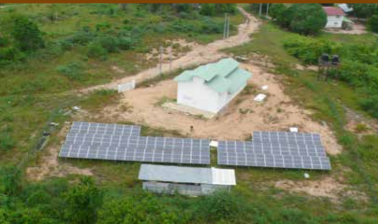
ELECTRIFICATION RURALE Construite par la CCOG, la plus grande centrale électrique hybride de France se situe dans la commune de Maripasoula.