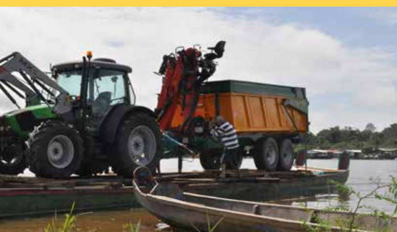
GESTION DES DÉCHETS La CCOG s'adapte au contexte local pour la collecte d'ordures sur le haut Maroni.