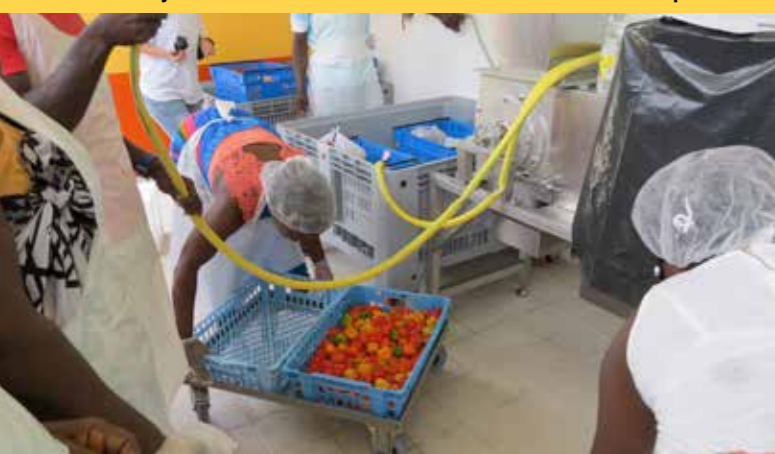
DÉVELOPPEMENT RURAL Situé à Mana et mis en service en 2014 par la CCOG le Pôle Agro-alimentaire a pour finalité de promouvoir l'économie locale.