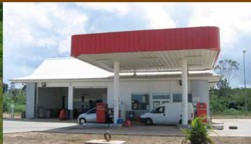
DÉVELOPPEMENT ÉCONOMIQUE La CCOG développe l'immobilier d'entreprise dont les centres multiservices, ici la station service de Mana.